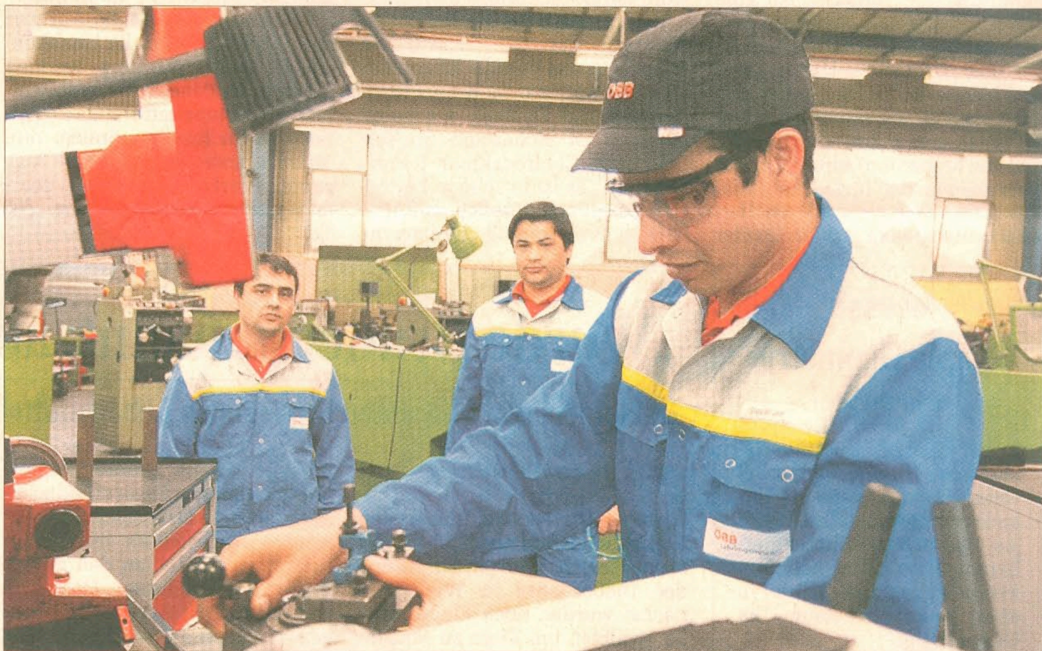
Mit ihrem Engagement für junge Flüchtlinge setzen die ÖBB ein Zeichen für starkes Verantwortungsbewusstsein.